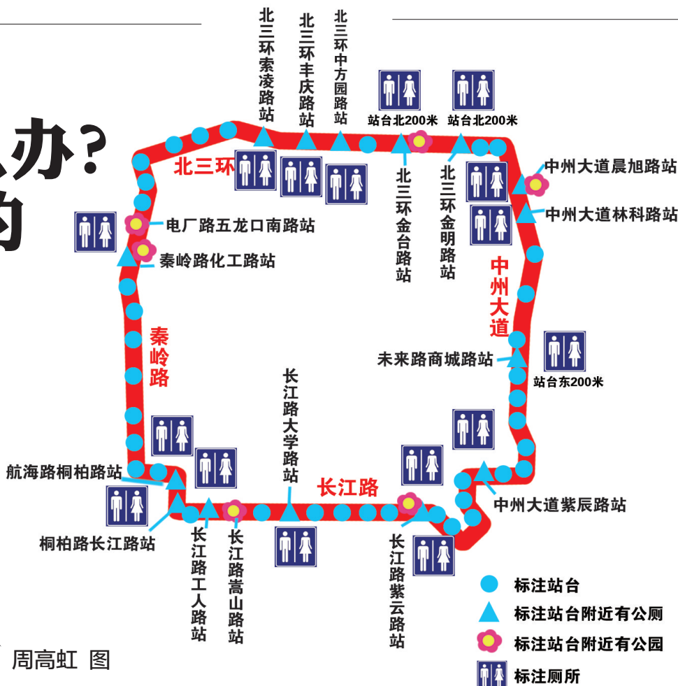
北