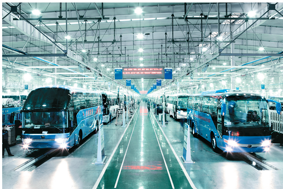
郑州宇通客车股份有限公司节能与新能源客车生产车间