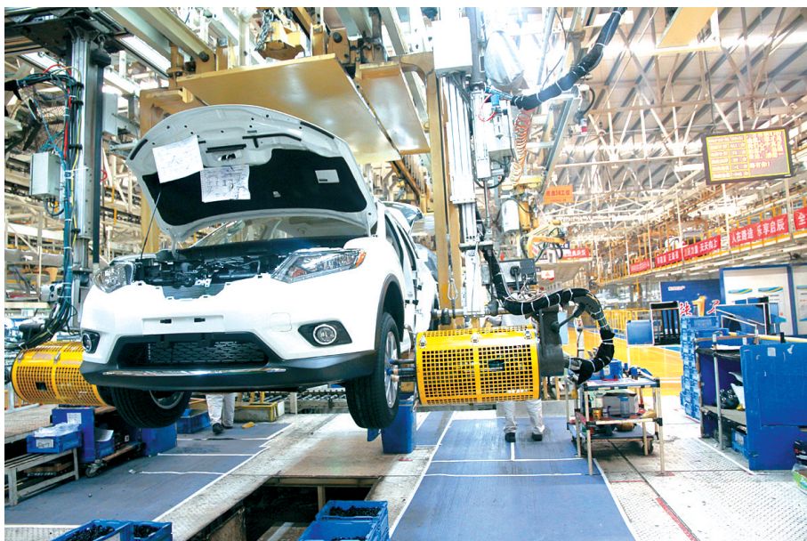
郑州日产第二工厂总装车间