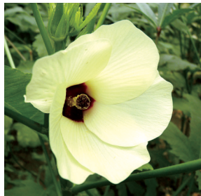
邵氏生产基地黄秋葵花

河南邵氏生态农业科技有限公司(以下简称邵氏生态农业)成立于2013年,位于经开区留创园中兴产业园,是生态农业发展的一个参与者、践行者,公司以黄秋葵种植、生产、深加工、研发一体化为主要发展方向,以农村专业合作社为基地,拥有种植面积达6000余亩的农、牧、渔业基地。目前公司黄秋葵深加工产品品类最多,市场占有率最高,中国无公害基地500强,是省无公害生产基地、示范基地、标准化生产基地。