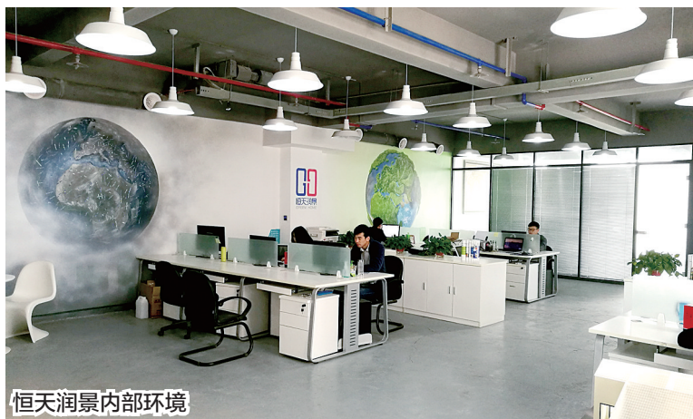
恒天润景内部环境

生品”,真正将其发展成一种特色高效产业。在未来,顺应这样的变化,回归品质与品牌并重的生态农业发展正道,真正走进消费者的心中,希望能成为行业的新标杆,为品牌提升提供更高的价值!