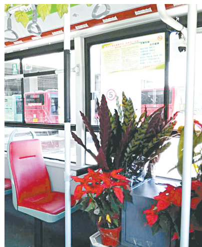
摆满绿植的公交车厢