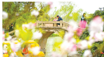
仙境拱桥,老少悠然