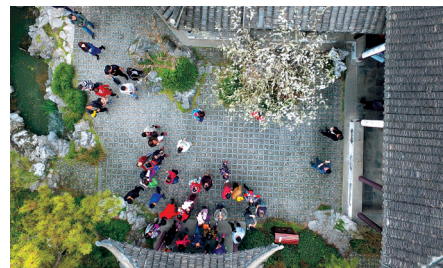
天井方寸,游人如蚁