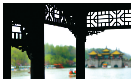
阁外静波,小舟迤迤