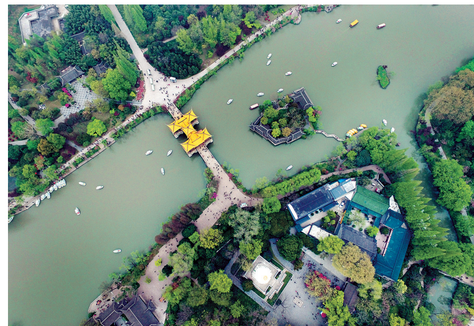
一桥相牵,步移景换