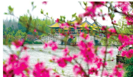
隔岸亭亭,神驰心飞

瘦西湖的“胖”还在于“瘦西湖风景名胜区”外部景点的扩容:往北,扩建有“双峰云栈”、唐子城景区等;向东,宋夹城体育休闲公园已建成开放;临南,文化休闲区“虹桥坊”自开业起就被定位为“城市客厅”……瘦西湖的内外扩容,带动了整座扬州城的环境建设。如今的瘦西湖,是扬州休闲度假式旅游的一个发端,作为当地独特的资源,成为提升城市价值的关键所在。