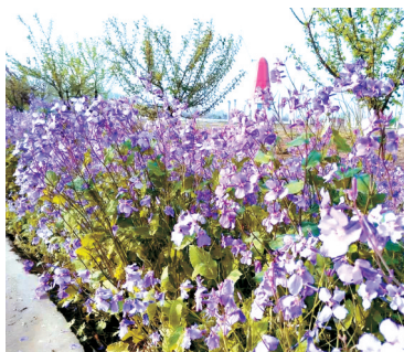
乡河湾四季花海拍摄基地

花海、沙堡、田间、小鱼塘……来到乡河湾,你可以静静地寻香赏花,可以去沙堡玩沙回忆美好的童年时光,可以到鱼塘边享受垂钓时静静等待收获时的惬意,还可以到绿植课堂,去体验自己动手收获美丽的乐趣。