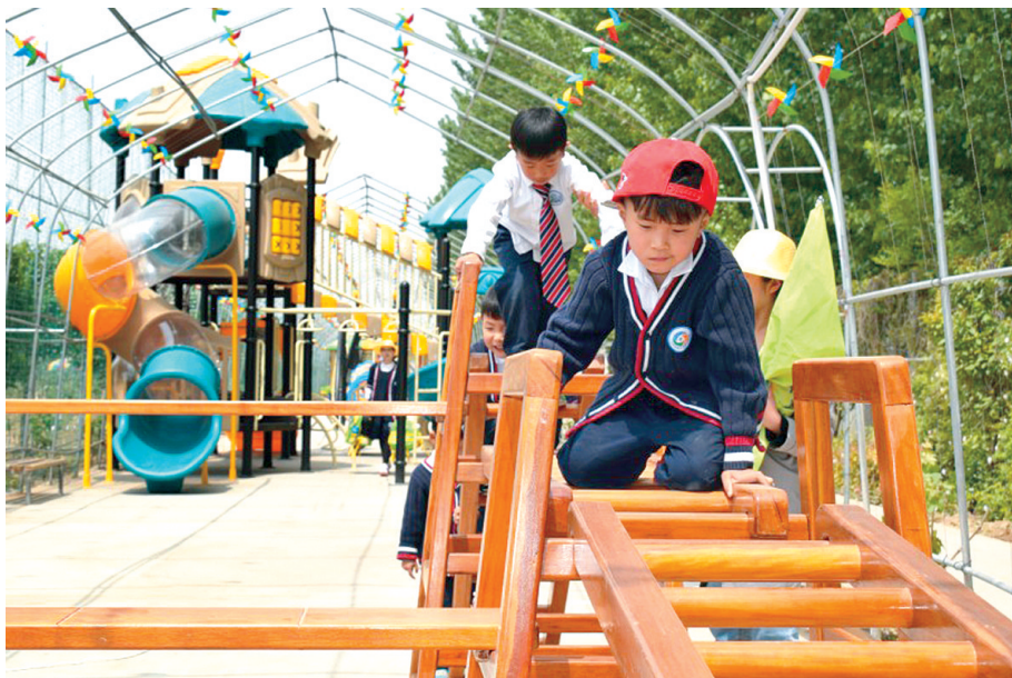
幼儿园的小朋友在玫瑰乐园玩耍

惠济区正在倾力打造天蓝、地绿、山青、水秀、气爽、景美、路畅、城洁、人和的环境,快跟着记者来看看惠济又多了哪些好看好玩的地方吧! 记者 藺洋 通讯员 张花荣 杨瑞霞 文/图