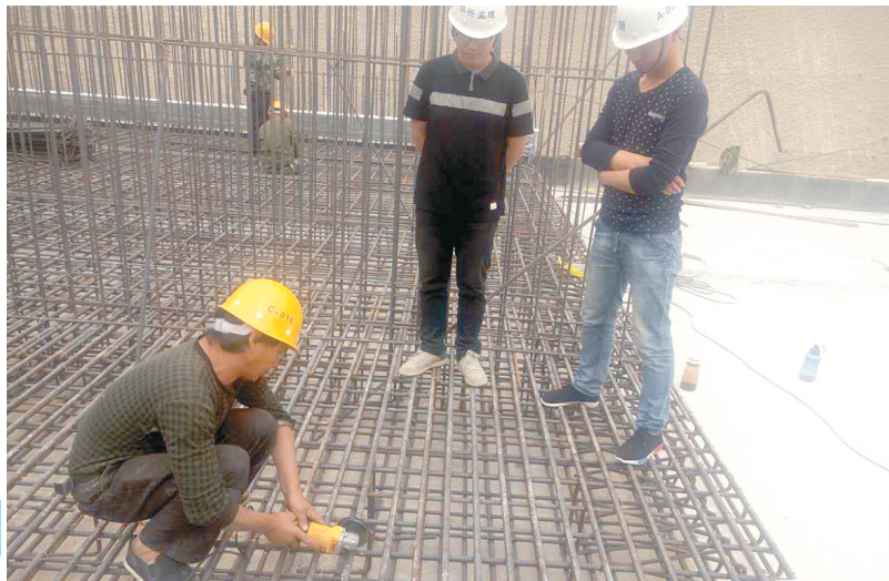
惠济花园口镇综合管廊首段底板钢筋进行验收