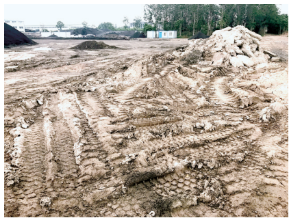
沙石料厂内黄土仍裸露