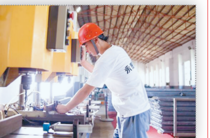
永威自有门窗,从源头把控质量