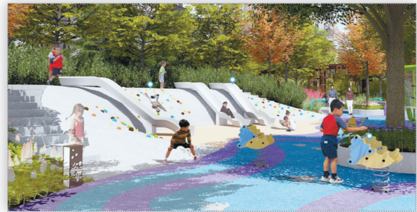
森林儿童乐园效果图

对于孩子来说,全天候成长空间让生活充满趣味,娱乐设施全部丹麦进口。0-3岁的天真宝贝乐园体系,4-6岁的好奇心广场体系,6-15岁的未来星活力营体系。 中老年活动中心配有国内领先品牌健身器材,安全保障、经久耐用。