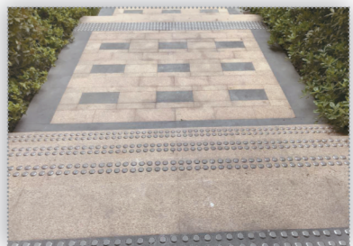
地面采用304不锈钢防滑钉铺设

在永威·森林花语,看得见的匠造追求让人们塑造了轻奢、舒适的居住感受,人在画中走的森林景观又增添了一丝浪漫情愫。“城市里奋斗,院子里享受”,多数人期盼的理想生活,在永威·森林花语一一呈现。