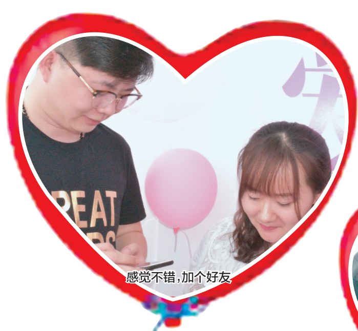
感觉不错,加个好友