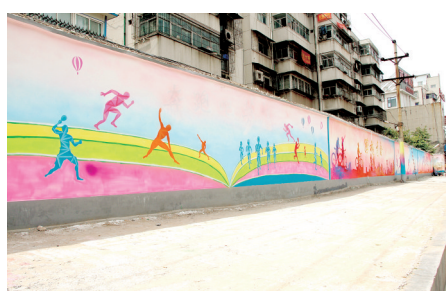
辖区陇海路中段3D运动涂鸦文化墙