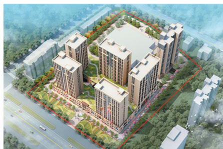
市重点项目——金盛国际商贸中心项目效果图