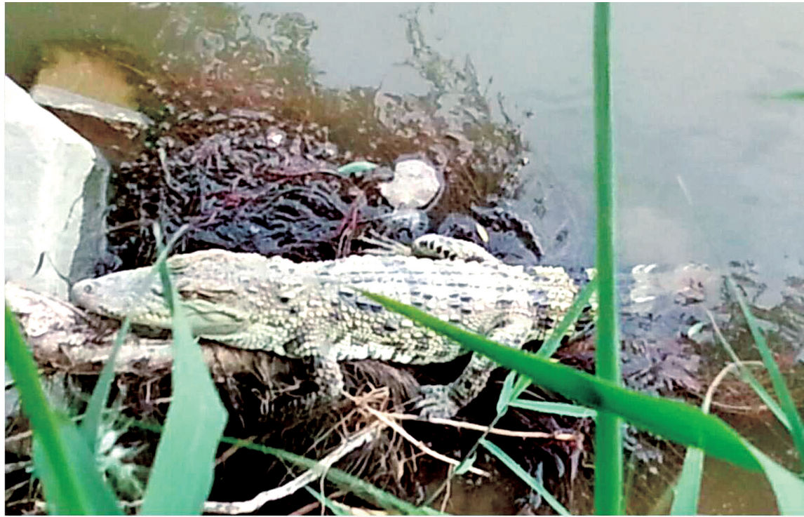
市民在黄河二桥附近发现的泰国鳄