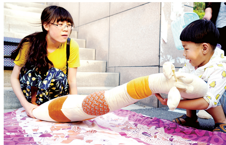
小朋友看中了这个玩偶