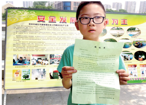
一名孩子在发放倡议书

本报讯 天气炎热,不少孩子喜欢戏水。每年这时候,郑州辖区水域,尤其是市区内,是孩子溺水事故多发期,尤以外来务工人员孩子居多。昨日,郑州市城区河道管理处组织开展“市民看城管之城区河道未成年人暑期安全教育活动”,志愿者在东风渠以及金水河边,向市民发放倡议书,希望孩子们远离水面,平安快乐过暑假。 郑报融媒记者 徐富盈 文/图