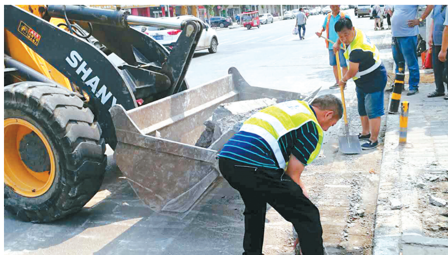
城管队员处理路边的碎石

晓率、支持率、参与率,营造良好的宣传氛围。 积极整改。社区及窗口单位要针对自查自纠和公众参与阶段查找出的问题作出改进,制定整改措施,落实整改责任。 下一步,国基路街道将积极督促社区及窗口单位狠抓行政服务态度,提高服务质量,打造优质高效服务环境,建树良好服务形象,坚持标准化、规范化和便捷化服务,创造良好的服务环境。 记者 鲁慧 通讯员 杨婧