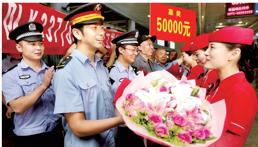
同事和亲人都来接站