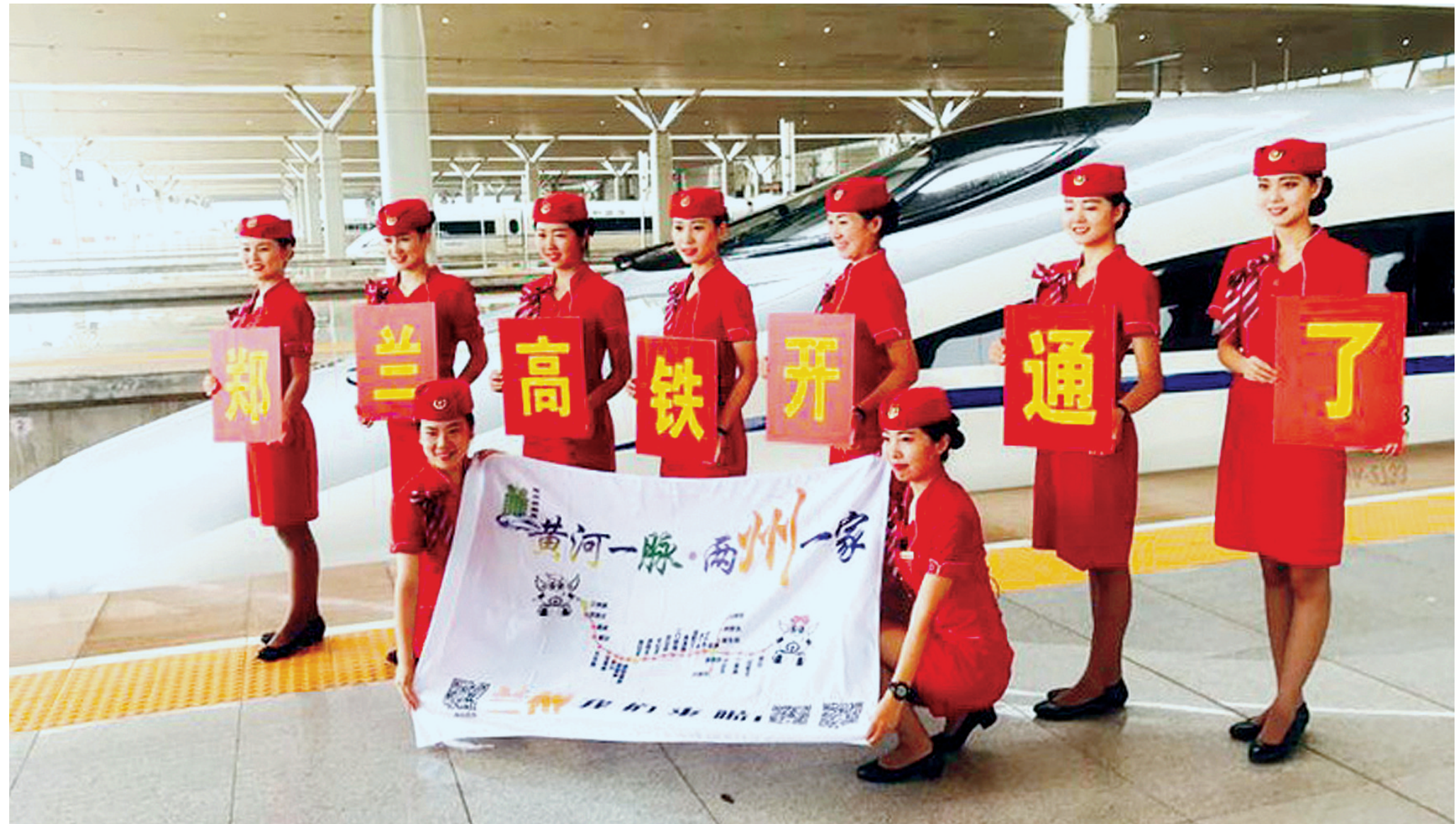
高姐庆祝宝兰高铁开通