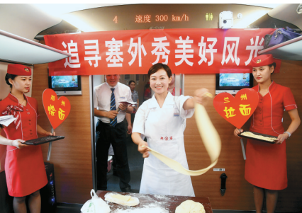
列车餐车师傅表演郑州烩面