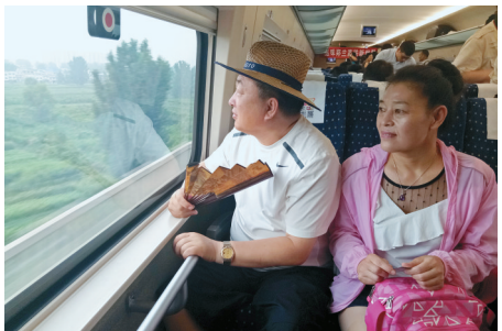
乘客观赏车外风景