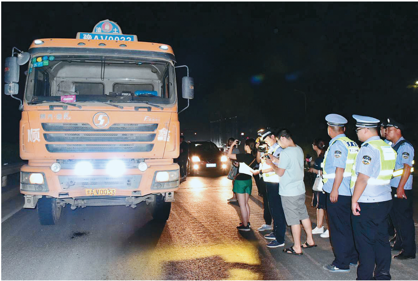
执法人员在西四环检查渣土车

执法部门将联系新闻媒体,对典型违法案件要大力曝光。自7月7日起,依据联合执法查处情况,对第一次被查处的违规清运公司,责令其停运整顿一周;再次发生的,禁止该清运公司三个月内在本市从事建筑垃圾运输;第三次发生的,禁止该公司六个月内在本市从事建筑垃圾运输;一个月内累计发生四次的,取消其建筑垃圾清运资质,不得在本市从事建筑垃圾运输。