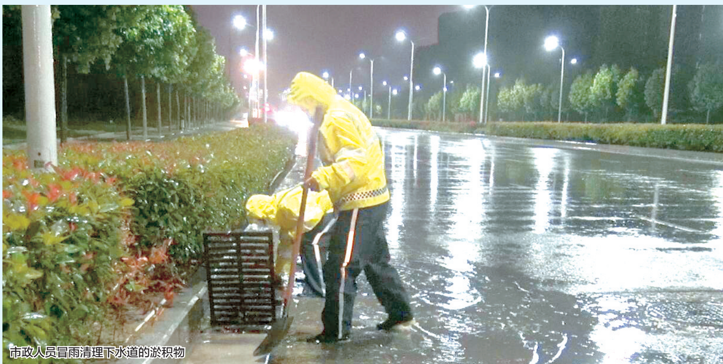
市政人员冒雨清理下水道的淤积物