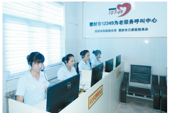
12349为老服务呼叫中心内景

急诊科 三康医院急诊科救援设备有急救车2辆、服务车3辆,抢救室3间,配备洗胃机、呼吸机、除颤仪、吸引器、供氧设备、输液泵、心电监护仪、彩超、B超、X光机、螺旋CT、化验、手术等。有创伤外科、骨科、内科、耳鼻喉科等多科救治医师为抢救、会诊、手术、治疗提供服务;对交通、工矿、施工、武校训练比赛等意外事故保证做到及时诊断处理,对内科急诊如脑出血、脑梗塞、脑血栓、各种心脏病、高血压、中毒及急腹症做到及时准确的救治。一年365天值班,每天24小时候诊。 三条线急救电话随时咨询:120转三康医院 :0371-62850999 13938258591