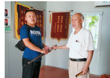
李大爷到公交调度室还伞