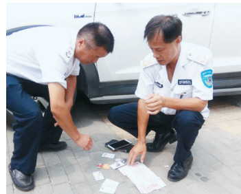
巡防队员清点钱包内的物品