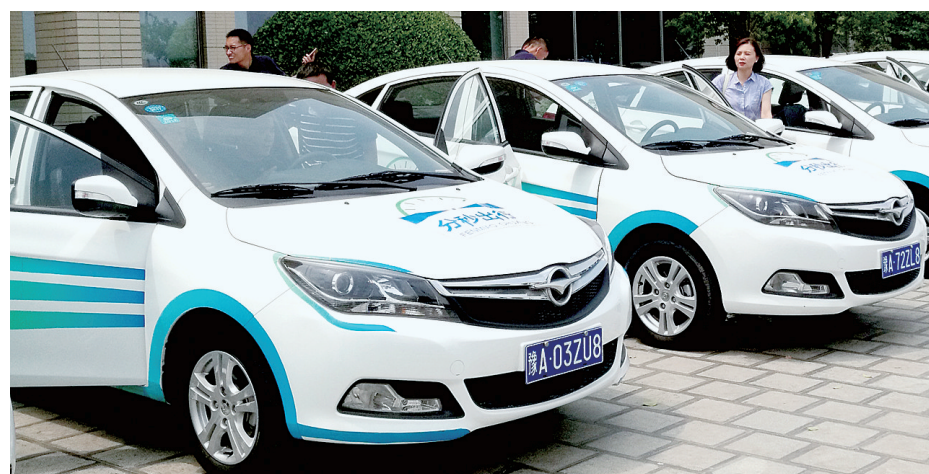
海马共享汽车吸引市民试驾

本报讯 就像租共享单车一样,在郑州街头也能租到共享新能源汽车……海马汽车联合庞大集团成立河南省内最大新能源汽车租赁公司——海马庞大新能源汽车分时租赁公司,推出自己的共享汽车产品“分秒出行”。市民只需下载APP,在街头定位共享汽车并下单、预定、支付,就能像租公共自行车一样,租到新能源汽车。