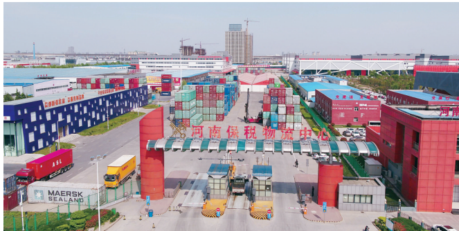
河南保税物流中心，这里成为全世界了解郑州跨境电商发展的最新窗口

作为一种新型业态，郑州跨境电商已成为河南对外开放发展、外贸转型升级的一张亮丽名片。