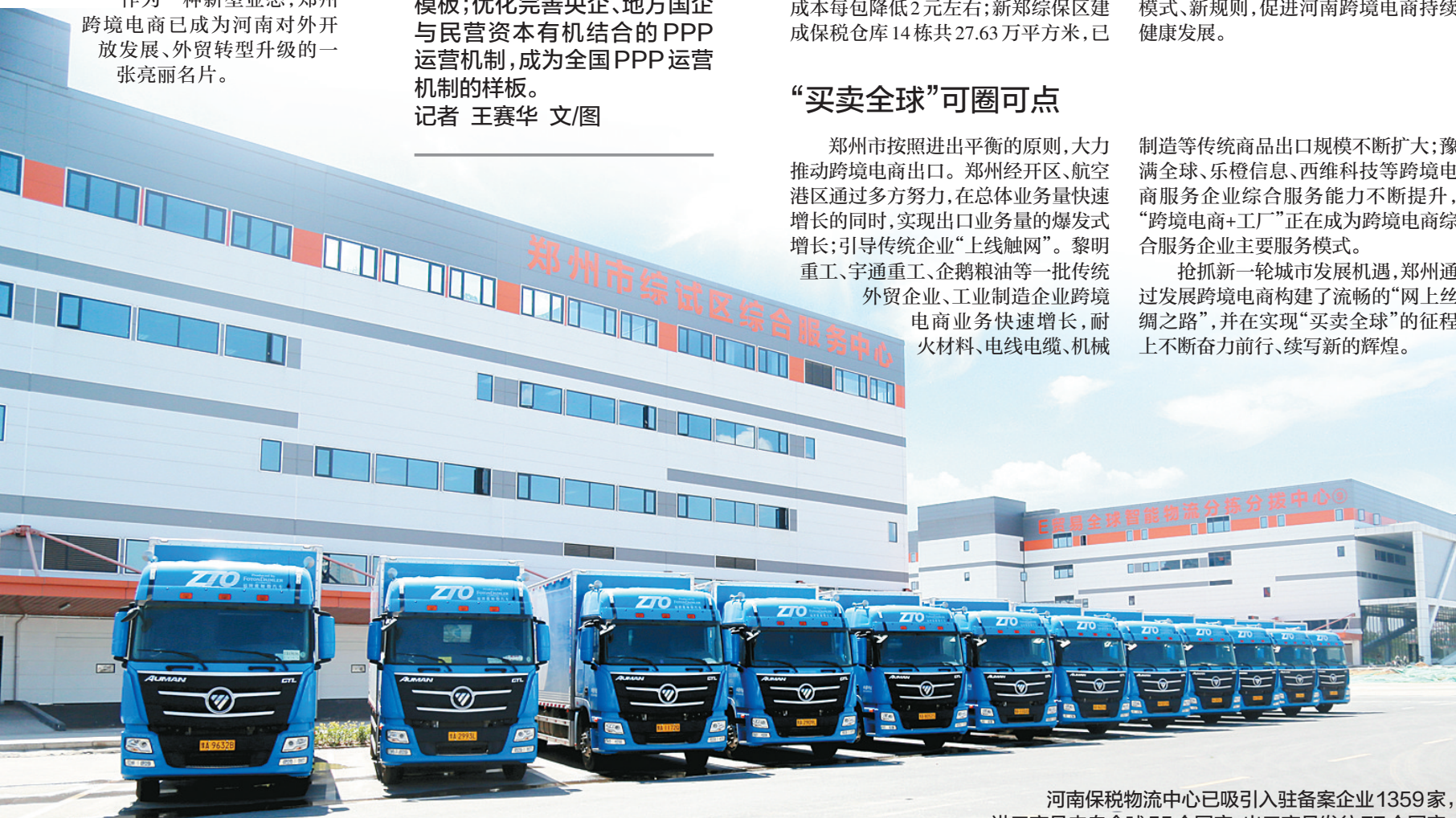
河南保税物流中心已吸引入驻备案企业1359家，进口商品来自全球55个国家，出口商品发往77个国家。

抢抓新一轮城市发展机遇，郑州通过发展跨境电商构建了流畅的“网上丝绸之路”，并在实现“买卖全球”的征程上不断奋力前行、续写新的辉煌。