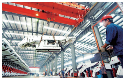
创新驱动战略加快推进,现代产业规模升级带动经济发展