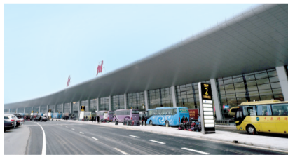
航空港实验区加快建设,航空客货运快速增长