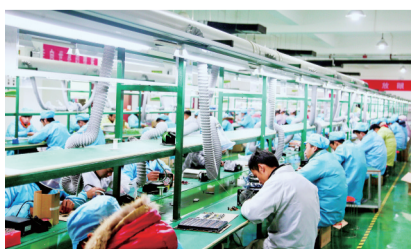
开放带动战略深入实施,上半年全市进出口总额继续位居中部省会城市第一