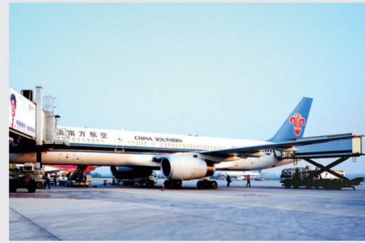
新郑国际机场货运繁忙

充分发挥比较优势,构建空中、陆上、海上、网上丝绸之路,大力实施大口岸、大通关、大物流战略,强化物流基础设施和配套服务设施建设,以航空、铁路、高速公路等为支撑,加快国际国内物流通道和集疏网络建设,积极发展多式联运和特色物流,实现“买全球、卖全球”目标,建成制度优、成本低、时效强、集疏便捷、运转高效的国际物流中心。