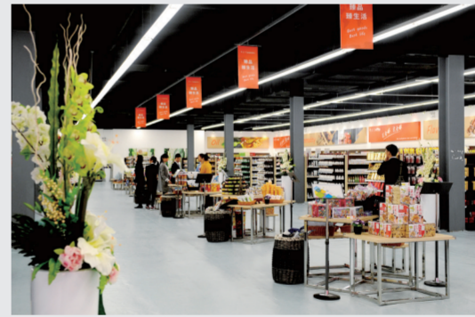
跨境E贸易买卖全球

深入融入“一带一路”战略,强化开放载体平台建设,推动形成投资自由化、贸易便利化、监管法治化的国际化营商环境。充分发挥区位和人文优势,加强对外合作交流,坚持走出去和引进来相结合,积极承办国际重要的文化活动、体育赛事和重要论坛、展会,提升国际化水平,加快形成具有全国辐射力、国际影响力的内陆对外开放门户。