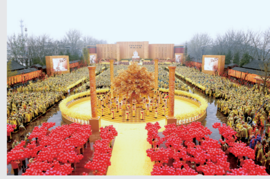
黄帝故里拜祖大典成世界级文化名片

加强文化遗产遗址保护利用,深度挖掘商都文化、嵩山文化、黄帝文化、黄河文化等资源,创新开发根亲文化、儒释道文化、功夫文化,坚持保护和利用相结合,传承与创新相结合,繁荣现代文化,打造城市名片、提升城市品位,不断提升文化全球吸引力、影响力和传播力,建成国际文化大都市和世界华人共同精神家园。