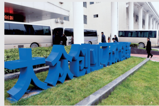
双创综合体激发双创造力

坚持以开放式创新为主导,以国家自主创新示范区建设为引领,大力引进国内外高水平大学和国家级科研院所,厚植创新基础。引进培育高端人才,优化创新创业生态环境,形成有利于创新、有利于创业、有利于激发人才活力的体制机制,建成国家重要的创新创业中心。