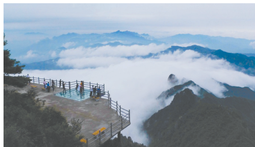
夏季的老君山清凉宜人

渡的地带,雨量充沛,气候湿润。夏季气候凉爽宜人,午前如春,午后如秋,夜如初冬。即便是三伏盛夏,鸡公山的平均温度也在23.7摄氏度,汗水、燥热、暴晒根本不属于鸡公山,故有‘三伏炎热人欲死,清凉到此顿疑仙’之美誉。”