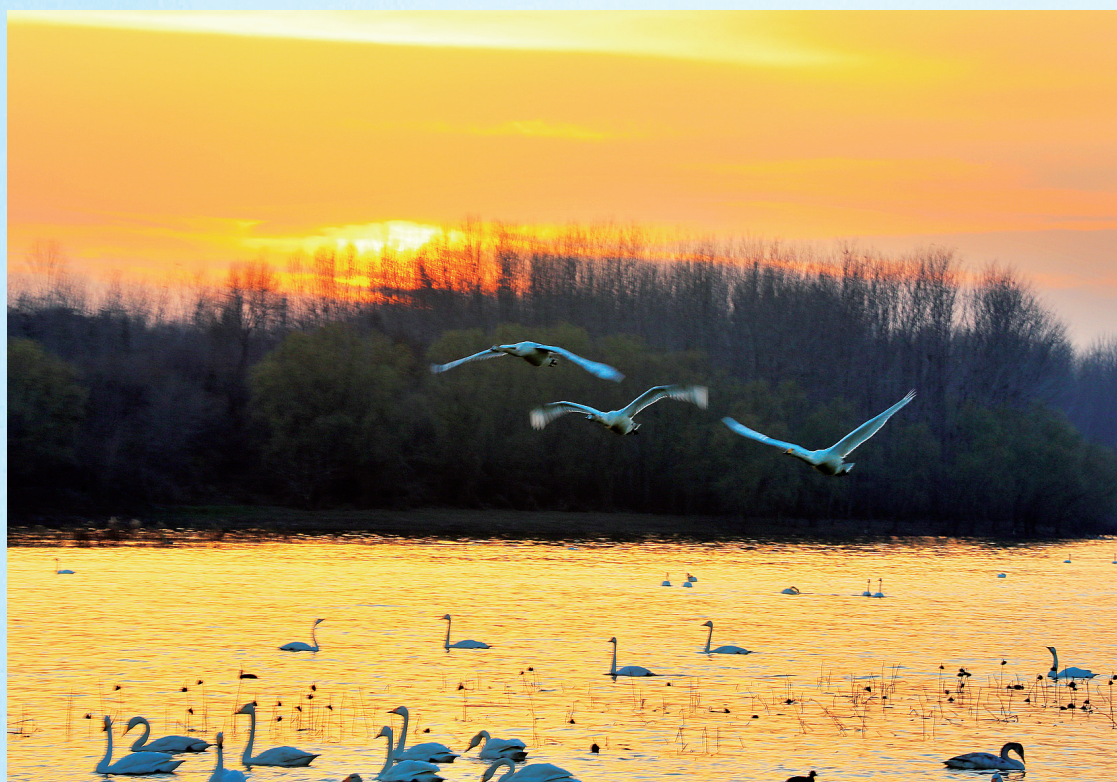
天鹅湖湿地公园里天鹅在自由翱翔