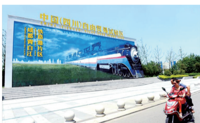
成都青白江铁路港片区