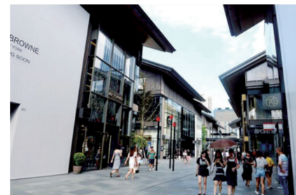
成都远洋太古里街区一景