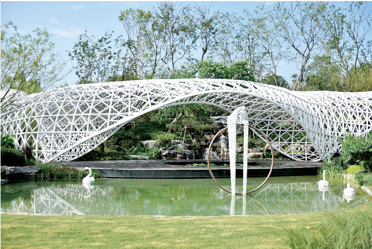
上海慧园的特色廊架

郑州园博园上海慧园,从天空看形似申城的“申”,那里甚至还有具有象征意义的“黄浦江”。上海慧园里,堆坡筑石,拾级而上,溪水潺潺,描绘了上海现代都市关于“诗与远方”的思考。精致的迷你花园,在小空间中聆听自然的声音,展现了上海人的慧生活。