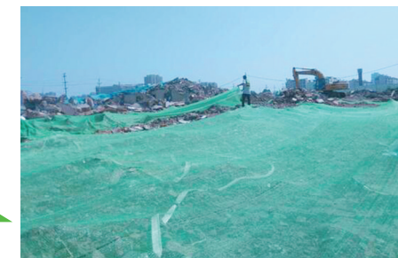
明湖办事处老南岗工地现场已覆盖

事处督导检查168次,京航办事处48次,潮河办事处60次,主要针对辖区30个拆迁待建工地卫生整治工作进行检查,对90个在建工地整治工作进行检查。针对存在的问题,下发整改通知书161份,整改率达到80%。