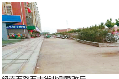
经南五路五大街北侧整改后