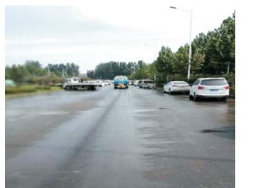
二十二大街与航海路交叉口整改后

1458个,清理生活垃圾56230立方米,混合垃圾5200立方米,冲洗道路面积425万平方米,使经开区市容环境卫生质量得到了显著提高,市容环境卫生整治工作取得了阶段性效果。