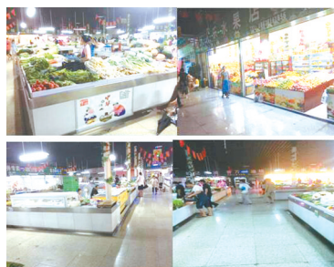
国联农贸市场整改后

指挥部一直严格按照“双迎攻坚”方案的要求做好相关工作,努力使辖区内集贸市场治理工作常态化,确保顺利通过考评验收和复审,进一步完善城市基础设施,强化城市管理,改善人居环境,更好地方便人民生活。