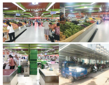
东盛农贸市场整改后