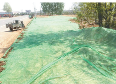
二十二大街锦绣小区对面小路整改后