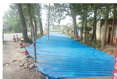
营岗铁路涵洞向北整改后