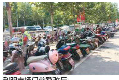
利明市场门前整改后