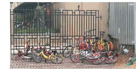
阅山公馆门口整改前后