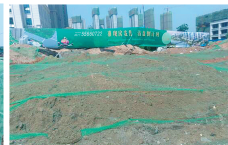
潮河办事处拓丰祥和居工地混合垃圾已清理