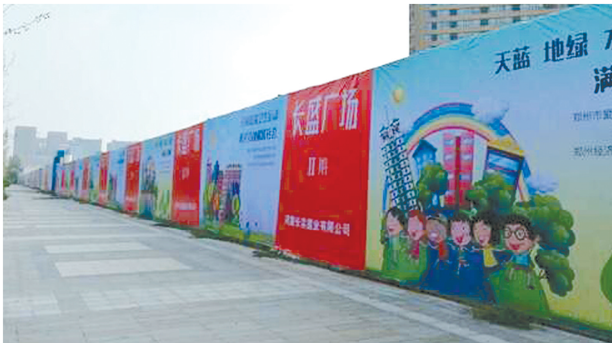
经北四路与第八大街交叉口向北150米路西广告牌整改后