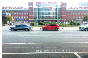
第七人民医院门前整改前

区交通秩序治理指挥部多次迎接了市“双迎攻坚”领导小组的督导暗访,加大整治力度发现问题总数325个,达标305个,达标率95%,而基本达标数已达312个,达标率97%,交通状况已取得明显改善。