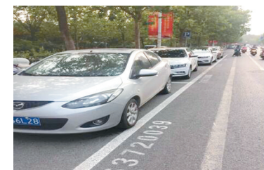
第七人民医院门前整改后