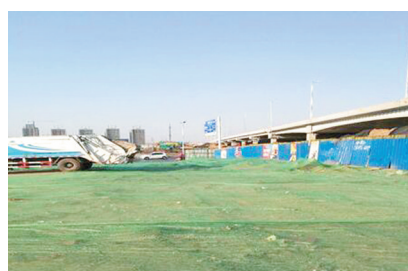
经南三路与107辅道高架桥西南整改后