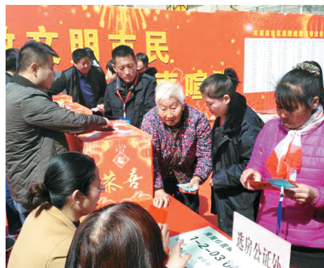
选房现场(资料图片)

本报讯 2017年是白沙镇全域都市化建设计划的第二年。镇党委、政府突出党建引领,在保持“白沙生金”的基础上全力打造“白沙白云”,同步实施“美丽白沙、都市白沙、利民白沙”,全镇各项工作均取得较好成绩。 记者 王阳 实习记者 钱凯悦 通讯员 袁书华 文/图