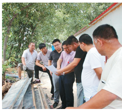
上下同心,攻坚克难

本报讯 2017年以来,龙源路党工委、办事处加快推进“五个城区”建设,按照“四重点一稳定一保证”工作总格局,集中精力抓推进,强化服务水平、保障施工环境、推动项目顺利进场,促进了办事处经济和各项事业又好又快发展。 记者 王阳 实习记者 钱凯悦 通讯员 王晓兰 文/图