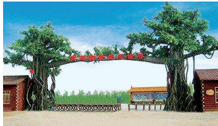
黄河富景生态世界

乘车路线: 游7路:首末站点:琉璃寺新村—普兰斯薰衣草庄园;首末班时间:7:00~18:00;票价2元,ABCD卡可用。途经道路少林路、文化路、英才街、花园路、G107、黄京线、赵兰庄、010乡道黄古线、普兰斯薰衣草庄园。