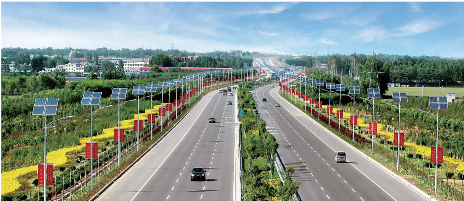
郑新快速通道生态廊道建设

今年以来,郑州各县(市)坚持“以水润城”,按照“扩充水源、提升水量、改善水质、扩大水面”要求,以河道整治为主导,对水系进行高标准、全方位规划建设,打造水域景观,提升城市品位和城市形象。积极探索文化遗产保护与城市建设相互促进的新路,提升城市文化品位。