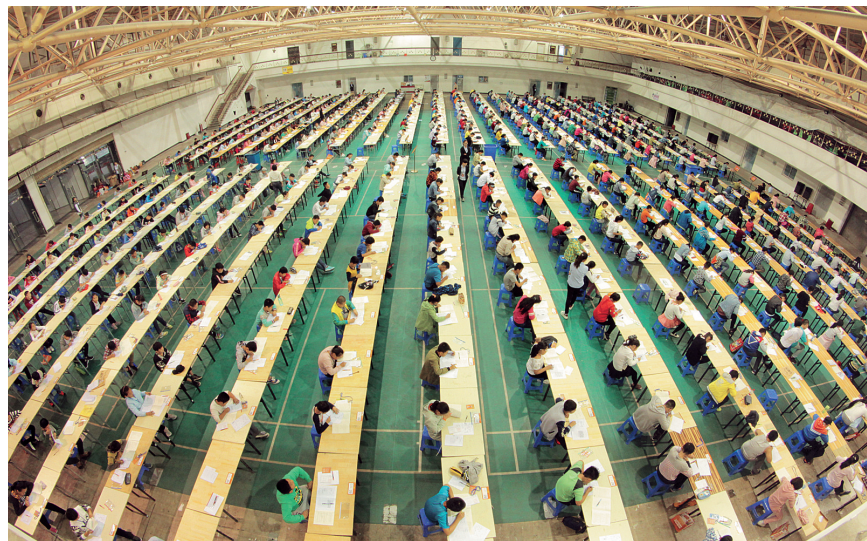
“新媒杯”小升初大数据模测联赛备受追捧