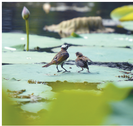
郑东新区北湖湿地公园