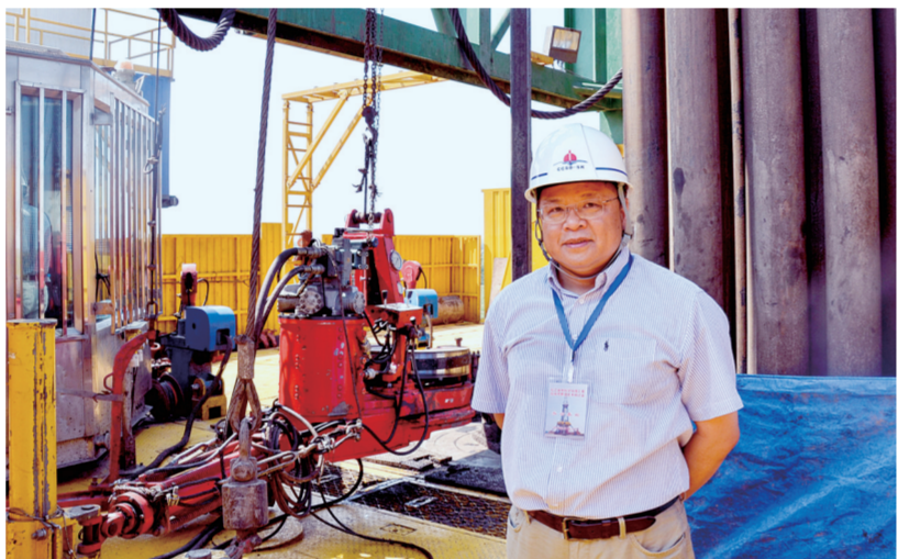
战略科学家黄大年放弃海外优渥的生活,回到国内报效祖国 新华社发