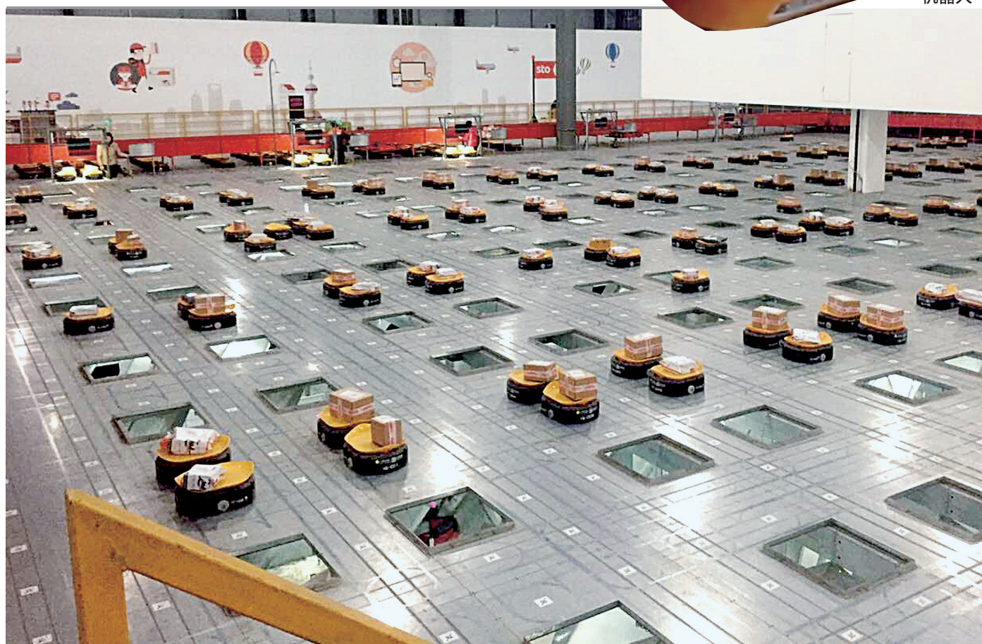
小黄人机器人分拣快件