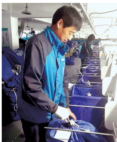
大型自拣设备,只需少量人员操作

当然了,对这些干活的快递小哥,高峰期也会给予各种补助,有住宿、有食堂,免费为他们提供吃住。