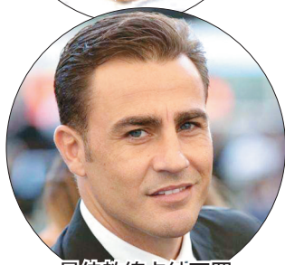
最佳教练卡纳瓦罗