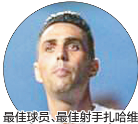
最佳球员、最佳射手扎哈维

“我真的很激动,也为自己感到骄傲,这是一个特别的时刻,我成为第一个登上高尔夫球世界第一的中国选手,而且是在祖国做到的。”冯珊珊赛后激动地说,“我希望所有中国人看到我都会说,中国人也能打好高尔夫球。希望更多中国人能打入LPGA巡回赛,未来中国会有更多世界第一。” 广日