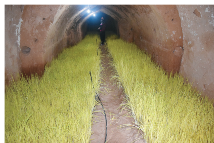
历时21天,蒜黄长势喜人

本报讯 提起窑洞,大多数人脑海中可能出现了土黄色的“山洞”。可是,新郑市具茨山管委会苗家沟的窑洞里,一畦畦蒜黄长势喜人,其中一孔窑洞中的蒜黄已经可以收割了,闻讯而来的附近农家乐的老板已数次致电咨询。