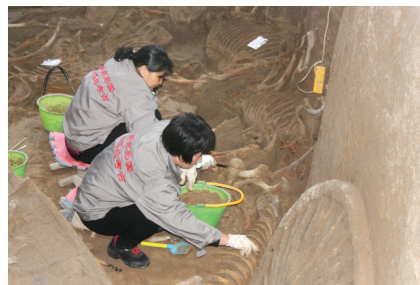
工作人员在认真清理马骨