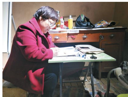
现场工作人员对资料记录整理