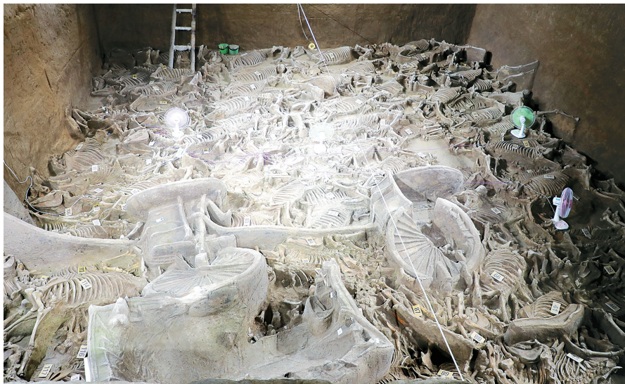
郑国三号车马坑发掘现场

11月11日,记者从新郑市旅游和文物局了解到,经过10个月的新郑郑国三号车马坑考古发掘工作全面结束,共发掘出122具陪葬马匹和4辆马车,随之出土的还有车上的青铜构件等装饰品。此次发掘的马骨数量创郑韩故城考古之最,其中一辆鞍车,也是迄今为止郑韩故城内形制最大、装修最奢华的国君用车。 记者 杨宜锦 新郑时报 邓春丽 文/图