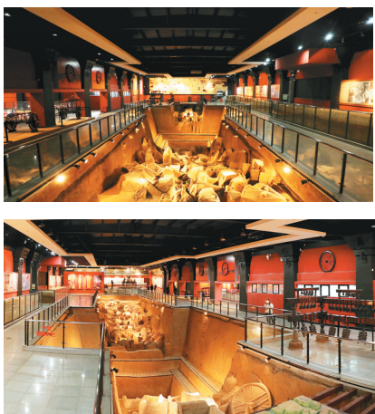
郑公大墓墓道内主要陪葬车