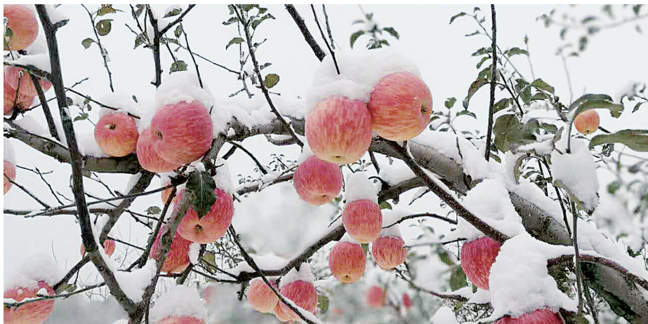
灵宝寺河山苹果种植区