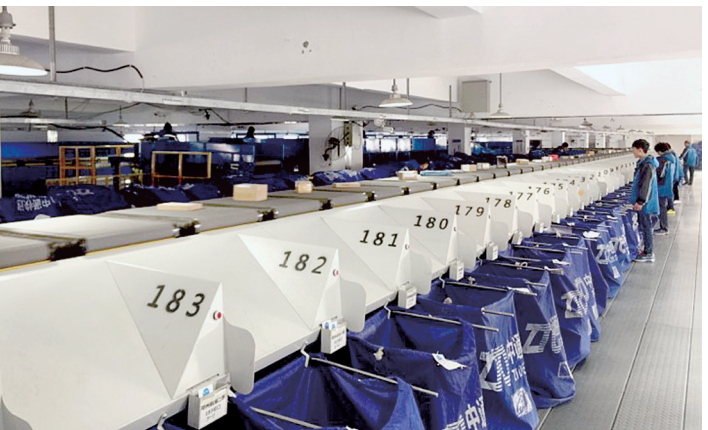
郑州经济凸显品牌效应

标准决定质量,质量塑造品牌。自2014年我市开展创建全国质量强市示范城市工作以来,通过不断加强标准、检验检测、认证认可等质量基础建设,已在一些优势领域形成了一大批掌握标准“话语权”的标杆企业,“郑州标准”“郑州质量”“郑州品牌”的名片效应逐渐显现。郑报融媒记者 聂春洁/文 宋晔/图