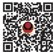
官微二维码 东风路分局