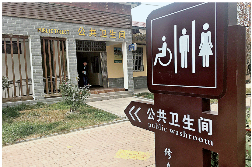
桃贾路康泰路交叉口公厕外观

同时，为了保障公厕用品物尽其用，城管执法局市环境卫生管理处、生态廊道绿化管理处等监管单位还制定了公厕用品管理制度，做到发放有台账、更换有记录。同时他们对公厕保洁人员做好培训，卫生间内的纸一旦用完，立刻更换新纸。线索提供 徐女士