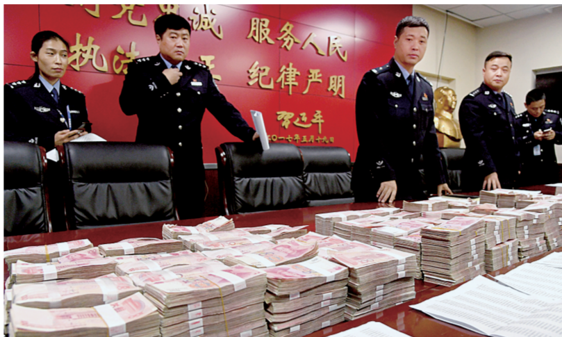
警方查扣的涉案现金

10月18日下午5点，上百人警组赶往风雅颂小区。整个抓捕行动用了半个多小时，当场抓获92名嫌疑人，缴获作案手机45部、电脑98台以及记有大量公民个人信息的台账、诈骗术语等书证物证。