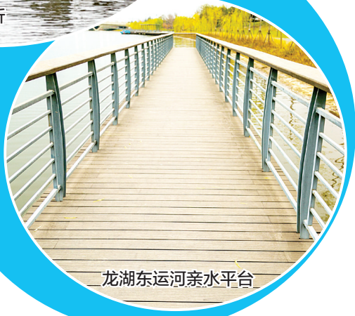
龙湖东运河亲水平台