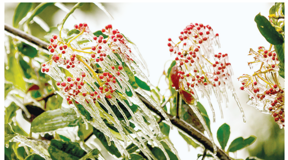
冰挂冰凌美轮美奂