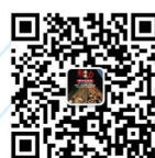
扫码关注更多贵州旅游资讯