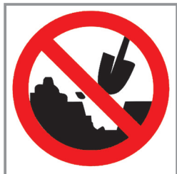
回访曝光单位 推进“封土行动”