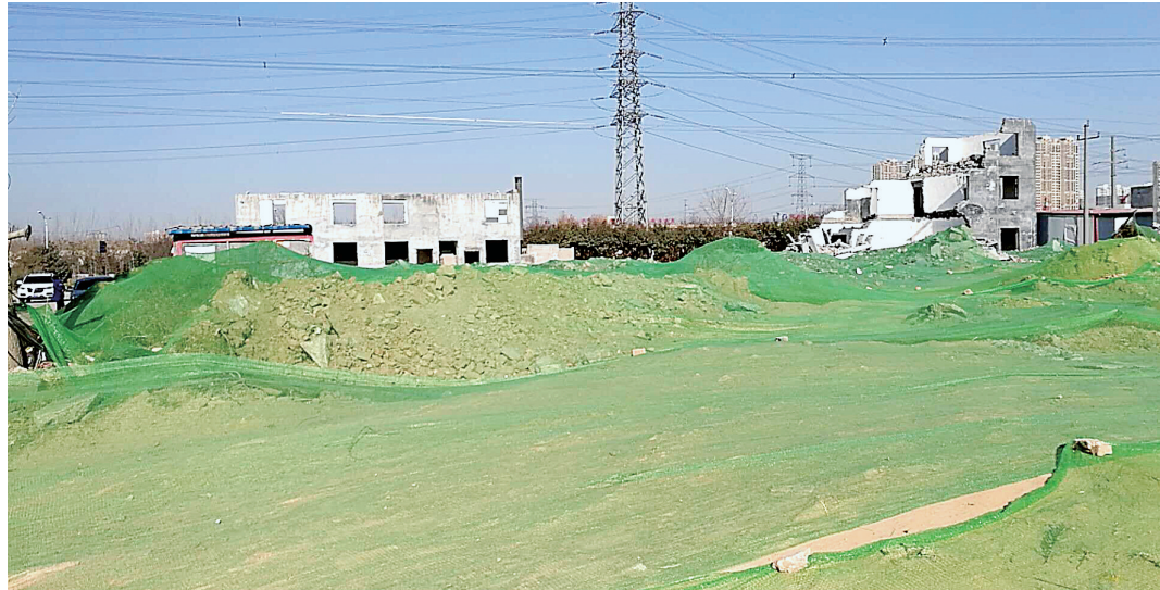
工地裸露部分全部覆盖防尘网

11月23日至26日,郑州市环境污染防治督导组重点对全市“封土行动”和橙色预警管控措施落实情况进行了督导检查。11月30日下午,郑州市环保局对督导发现的比较严重的10个单位进行通报批评并曝光。12月1日起,记者分别对被曝光单位进行回访。