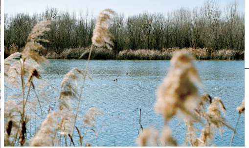
淇河沿岸风景优美,成群鸭子在水中游弋。